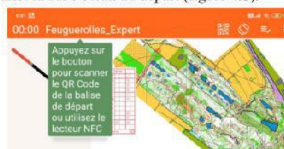
Figure 4.b : écran départ