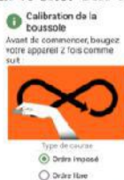
Figure 4.a : étalonnage boussole

À partir de maintenant, plus besoin d'avoir du réseau. Un écran d'étalonnage de la boussole apparaît (figure 4.a). Inutile de le faire à chaque fois. Vous pouvez choisir de parcourir le circuit en ordre libre ou imposé. Seul l'ordre imposé permet d'avoir une comparaison des performances sur le site. Une fois validé, vous arrivez sur l'écran du départ (figure 4.b).