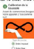
Figure 4.a : étalonnage boussole

À partir de maintenant, plus besoin d'avoir du réseau. Un écran d'étalonnage de la boussole apparaît (figure 4.a). Inutile de le faire à chaque fois. Vous pouvez choisir de parcourir le circuit en ordre libre ou imposé. Seul l'ordre imposé permet d'avoir une comparaison des performances sur le site. Une fois validé, vous arrivez sur l'écran du départ (figure 4.b).