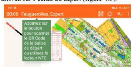
Figure 4.b : écran départ