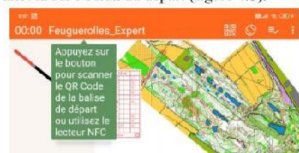
Figure 4.b : écran départ