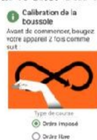
Figure 4.a : étalonnage boussole

À partir de maintenant, plus besoin d'avoir du réseau. Un écran d'étalonnage de la boussole apparaît (figure 4.a). Inutile de le faire à chaque fois. Vous pouvez choisir de parcourir le circuit en ordre libre ou imposé. Seul l'ordre imposé permet d'avoir une comparaison des performances sur le site. Une fois validé, vous arrivez sur l'écran du départ (figure 4.b).